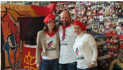
Amicale Béziers Standbesetzung auf der Gross Reisemesse

Interessierte können sich an den Verein für weitere Informationen wenden.