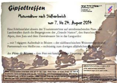
Flyer zur Motorradtour vom 07. bis 24. August